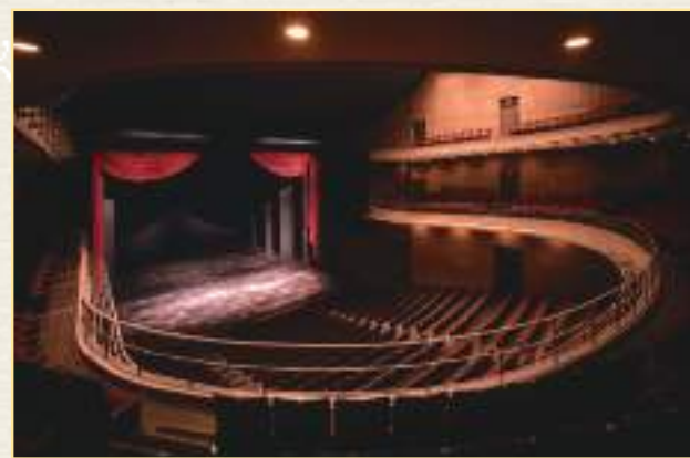
テアトロ・ジーリオ・ショウワ