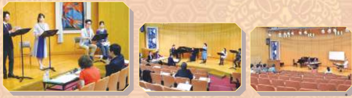
「令和元年度 次代の文化を創造する新進芸術家育成事業」 日本のオペラ作品をつくる～オペラ創作人材育成事業 第Ⅱ期より *撮影 長澤 直子